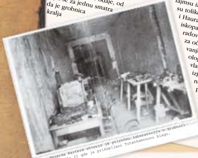
Tim Hauarda Kartera otvorio je prizumu laboratoriju u grobnici Setija II gde je prikupljano Tutankamonovo blago.

LONDON, 1. dec. – Na osnovu telegrafskog izveštaja iz Kaira tvrdi se da se vrednost predmeta koji se nalaze u dve oduke koje su egipatski istraživači nedavno pronašli na nalazištu drevne Tebe u blizini Luksora procenjuje na više od 3.000.000 €. U izveštaju pronađenih predmeta prevazilazi da količina mogućiosti predmeta prevazilazi da količina Druge zapečaćene oduke, od kojih se za jednu smatra da je grobnica kralja